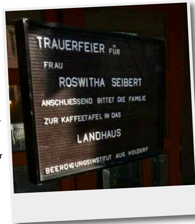
25. März 2019 Beisetzung in Fulda